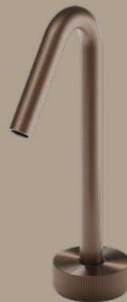
Cuivre brossé PVD