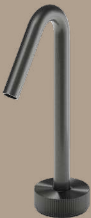
Noir brossé PVD