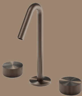
Robinets eau froide-chaude